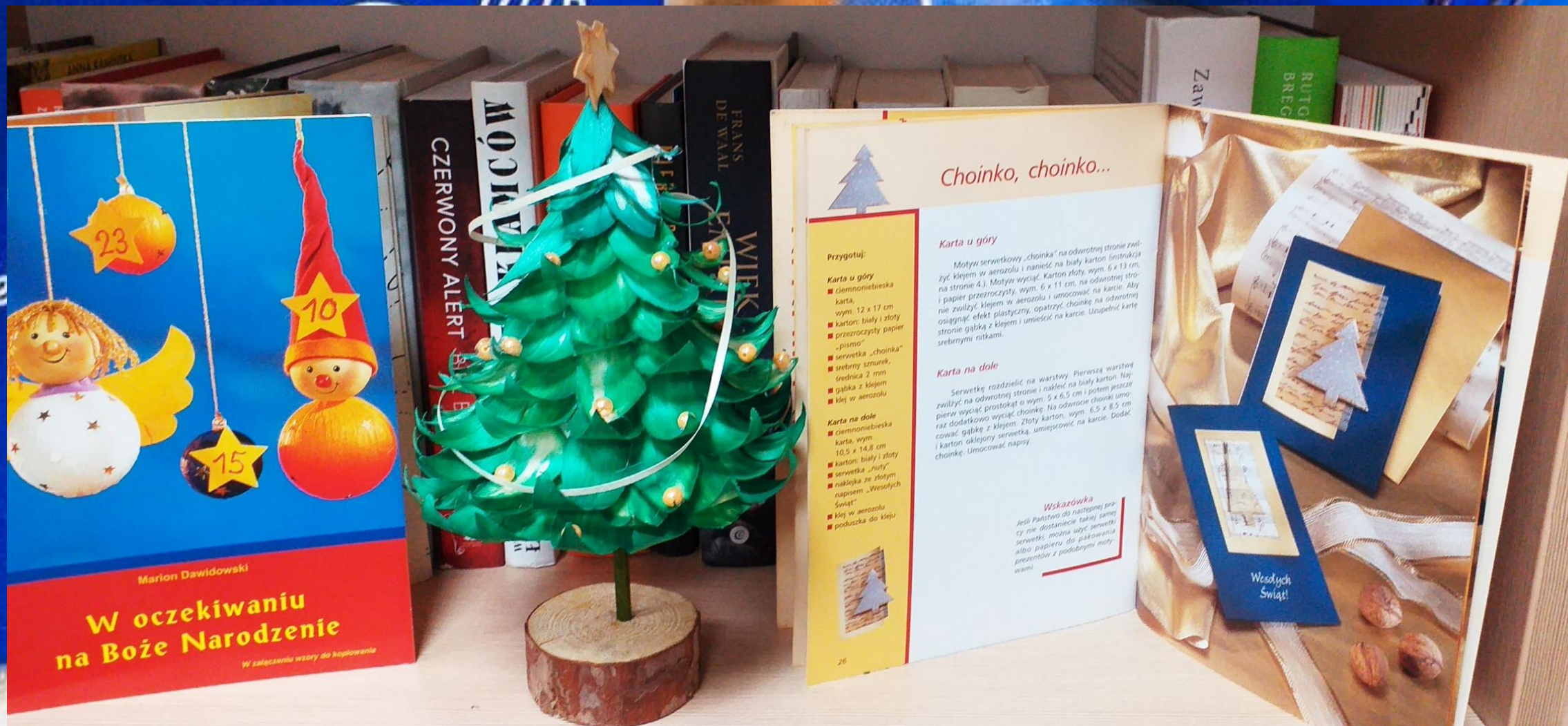
Z papieru i pięknych dodatków można wyczarować gustowne karty świąteczne.