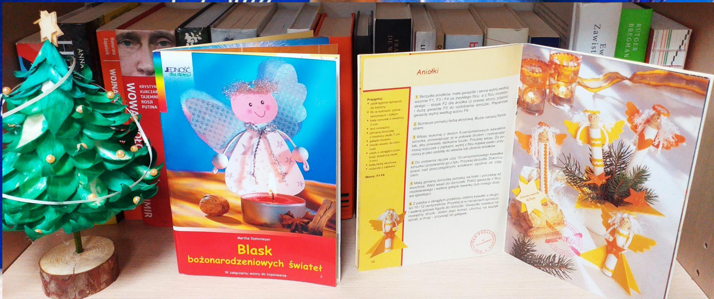
Bożonarodzeniowe dekoracje świetlne, gwiazdna mozaika, srebrny anioł... z papieru, drewna i naturalnych materiałów.